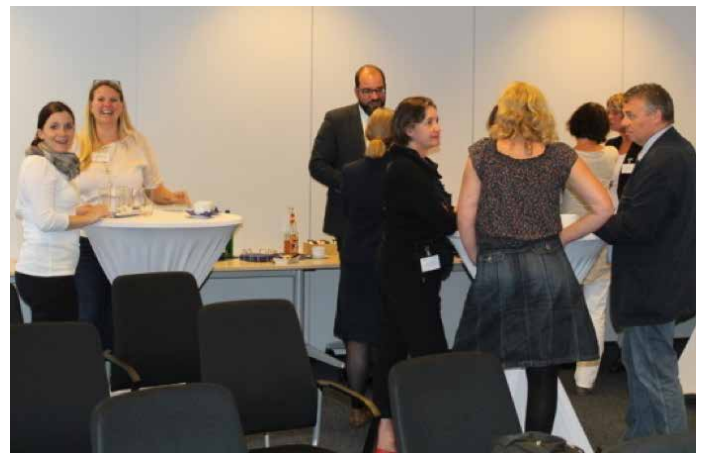
Nach den Vorträgen tauschten sich die Teilnehmerinnen und Teilnehmer beim anschließenden Get-together aus und knüpften neue Kontakte.

Sylvia Kestner, Forschungsinstitut Betriebliche Bildung (f-bb), gab einen allgemeinen Überblick der Methoden der Bedarfserhebung in der beruflichen Weiterbildung und ging während ihres Vortrages auf das Verfahren im Projekt ein. Besonders deutlich wurde, dass es keinen Königsweg gibt, mit dem der Bedarf erhoben werden kann. Die Auswahl der Methoden erfolgt immer angepasst an die jeweiligen Bedingungen.