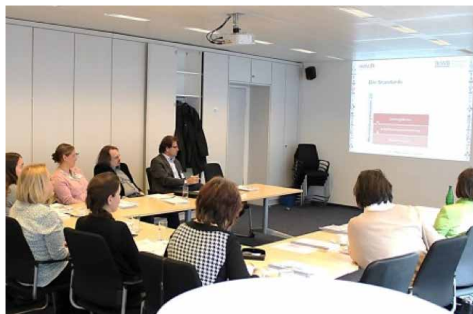
Netz3L bietet regelmäßig Veranstaltungen zu Themen der beruflichen Bildung an

Kompetenzorientierte Beschreibung von Angeboten in der beruflichen Weiterbildung